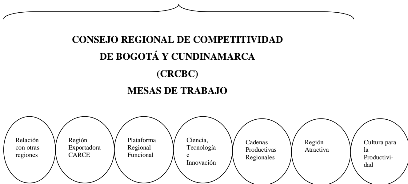
Gráfica 2: Mesas de trabajo del Consejo Regional de Competitividad de Bogotá y Cundinamarca. Año 2003

Conforme al objetivo del trabajo trataremos de identificar plenamente aquellas acciones que pueden adelantar las instituciones universitarias respecto a los propósitos identificados para cada grupo o mesas de gestión del Consejo Regional, los cuales se relacionan en la siguiente gráfica.