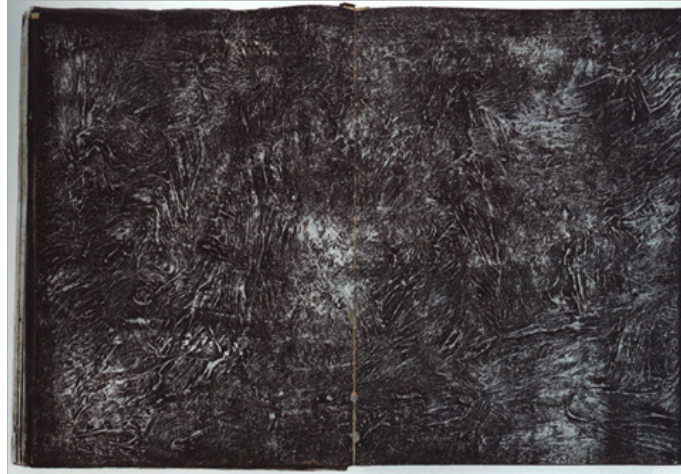
"The cauterization of the rural district of Buchen" Anselm Kiefer, 1974

La obra del artista Alemán Anselm Kiefer hace referencia a elementos que pertenecen a la naturaleza como el agua, la tierra y el fuego. Usa estos elementos conscientemente, ellos cobran vida propia y hablan de la naturaleza humana. Por ejemplo, en su obra "Cauterización de la zona rural de Buchen" el hombre es un agente que posibilita el cambio y en cuanto a la naturaleza podemos encontrar el fuego que no solo aparecerá como un elemento