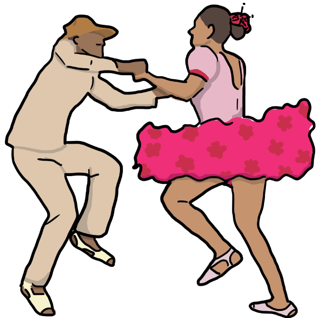
Ilustración de Sofía Hurtado

Estos ejemplos de compromiso, responsabilidad y trabajo constante desde la biblioteca pública llanera han abierto la posibilidad de nuevos espacios que permitan tejer comunidad y establecer nuevos discursos alrededor de la biblioteca pública. Espacios en los que la voz de todos consolide una comunidad que se preocupa por su región y hace uso de sus instituciones culturales para fortalecer el desarrollo económico, la creatividad y la innovación. Para comunicar y escuchar las voces de aquellos que quieren participación y desean la consolidación de una cultura llanera que trascienda el tiempo, la tradición oral y la escritura.