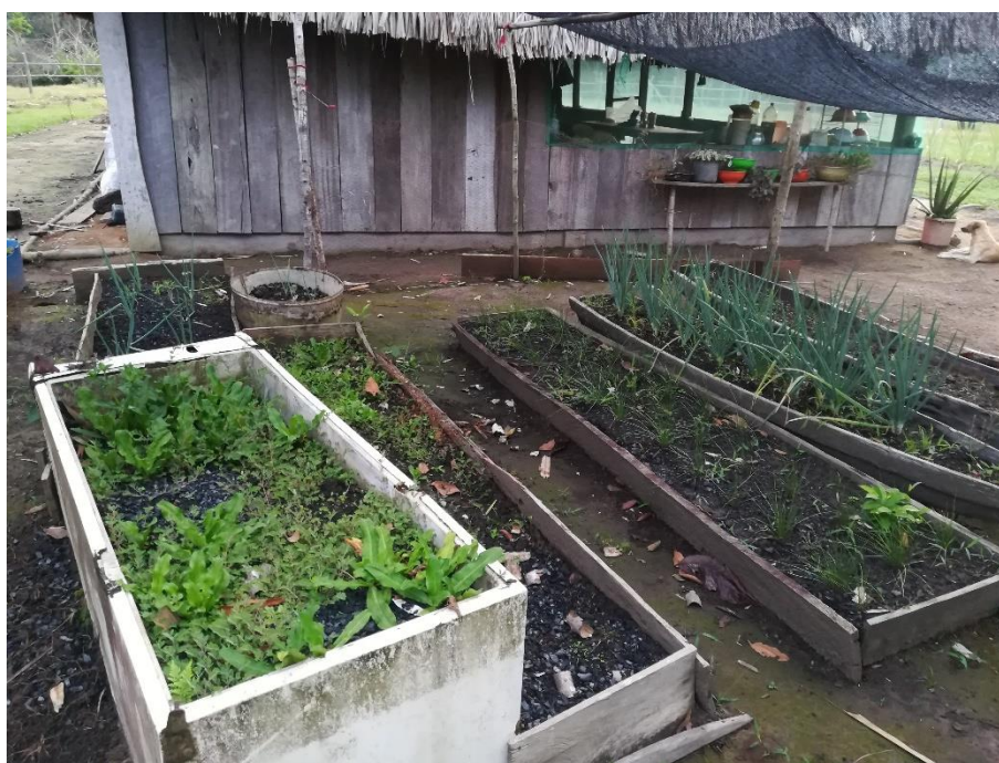
Imagen 3. Cocinas vivas. Imagen compartida por la Comunidad La Urbana. Sector Matavén Fruta. Noviembre 2020.

Sumado a lo anterior, una de las acciones acorde a la “cocinas vivas”, es la adopción de especies vegetales por cada familia. Con esta acción se busca que cada familia adopte una especie vegetal para que genere un conocimiento profundo de esta. Por ejemplo, la familia que adopta el ají, debe conocer los ciclos de cultivo, sus variedades, los productos que se pueden producir y las oportunidades de comercialización que se pueden abrir; así como la búsqueda de actores que apoyen los proyectos productivos ligados al ají.