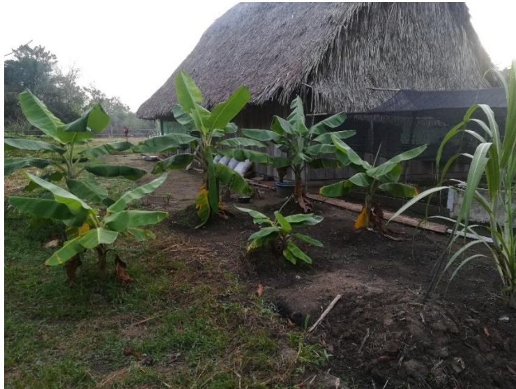
Imagen 2. Cocinas vivas. Imagen compartida por la Comunidad La Urbana. Sector Matavén Fruta. Noviembre 2020.

Otro ejemplo en el que se utilizan los principios de la agroecología en el territorio Piaroa son las cocinas vivas, entendiendo estas, como la siembra de especies vegetales alrededor de la casa para tener disponibilidad de alimentos y medicina tradicional, lo cual permite: no depender totalmente del conuco, el uso de abonos orgánicos, la conservación de semillas, así como contribuir en la reducción de la deforestación. Adicionalmente, las cocinas vivas son una respuesta ante el crecimiento de la población, pues inciden en que no aumente la presión sobre los bosques.