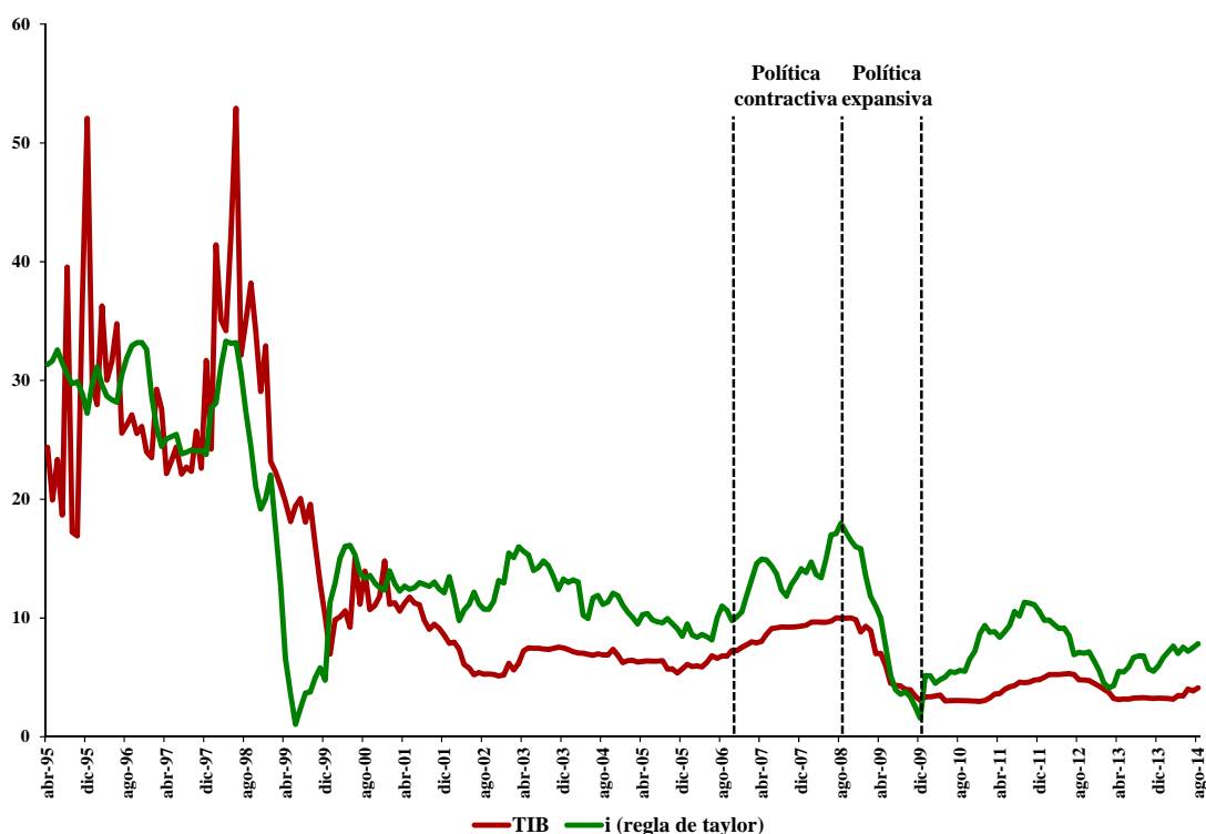
Gráfico No. 2 – Regla de Taylor vs. Política monetaria observada